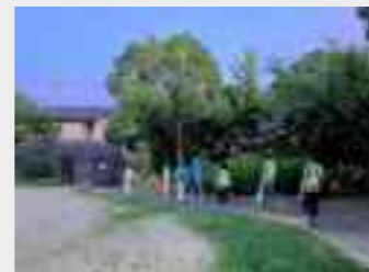
公園内をパトロールしている様子